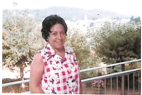
Alicia de Larrocha a can Torra, al fons es veu Viladrau.

A partir dels anys 70s, però, sobretot, dels 80s en endavant, la meua mare ja no va pujar gaire a Viladrau. El meu pare ens va deixar a l'agost del 1982, amb només 61 anys, i des d'aquell moment, en que va perdre el seu gran suport, ella es va refugiar en la música, viatjant encara més i fent molts més concerts dels que habitualment feia. L'última vegada que va anar-hi a passar el dia, va ser el 7 de juny del 2007. El seu estat de salut ja era molt feble. Anava en cadira de rodes perquè, des del 2004, que es va trencar el fèmur, mai es va tornar a recuperar del tot.