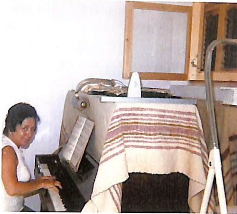
Alicia de Larrocha estudiant a l'habitació dels pianos, abans d'acabar la reforma de Can Torra. (Arxiu Alicia de Larrocha, 1974).

Durant les obres, no recordo que la meua mare estigues gaire involucrada perquè estava molt temps fora. El meu pare era qui s'encarregava de tot i li consultava les coses per telèfon o per carta, tal com ho havia fet abans de casar-se, amb el pis de Barcelona a on van anar-hi a viure.