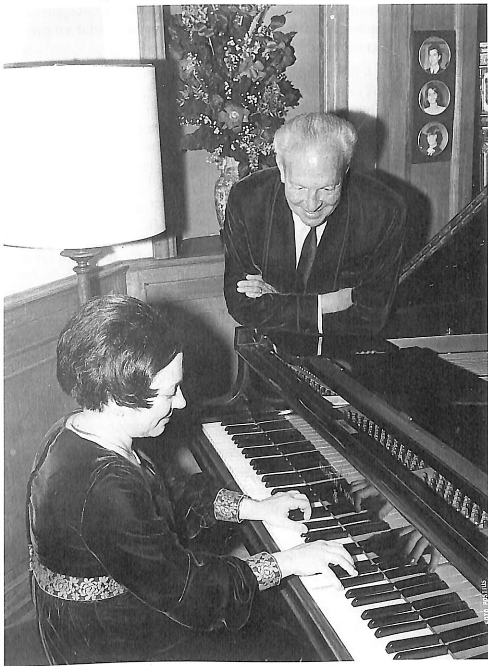
Recital d'Alicia de Larrocha a casa el dr. Trueta.

Com ja he dit, la figura del meu pare va ser molt important. Era el seu més gran admirador i és per això que sempre va estar al seu costat (que no darrere); que va intentar facilitar-li la vida perquè pogués compaginar