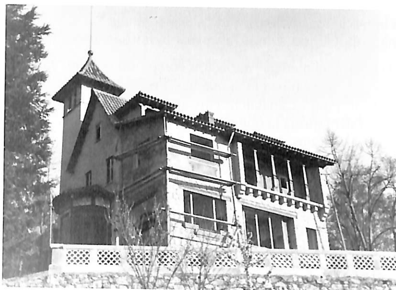
Obres d'ampliació del xalet Espriu, convertint-se en Can Torra. (Arxiu Alícia de Larrocha, 1944).

Tornem a mitjans dels anys 40. Va ser aleshores quan la meva mare va anar per primer cop a Viladrau. Al principi, per no anar-hi sola, anava a veure el seu xicot, acompanyada de les seves germanes i germà, o d'alguna amiga ja que, anar a casa dels senyors Torra (ja fos a Barcelona o a Viladrau) li feia molt de respecte. Ella venia d'una família senzilla i tenia por de no ser a la alçada. No estava acostumada a veure noies de servei, ni xofers, com era habitual a les cases benestants d'aquella època.