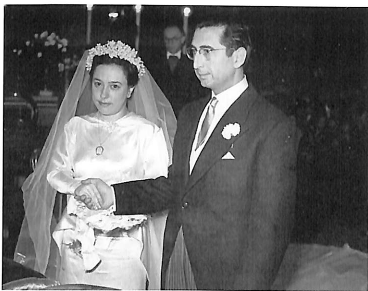
Casament Alicia i Joan. (Arxiu Alicia de Larrocha, 21 de juny del 1950).