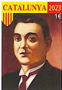
100 anys de la mort de Salvador Seguí i Rubià, conegut com el Noi del Sucre P06