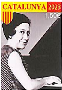
100 anys del naixement de Alicia de Larrocha de la Calle P07