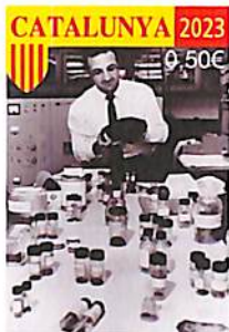
100 anys del naixement de Joan Oro i Florensa P05