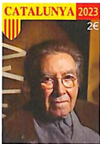
100 anys del naixement d'Antoni Tapies i Puig P08