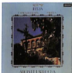
ISAAC ALBÉNIZ Ibèria. Cantos de España. Navarra (Decca, 1973)

Escriure sobre Alícia de Larrocha (Barcelona, 1923-2009) és fer-ho sobre un dels 'monstres' de la música clàssica a Catalunya. El seu nom serà sinònim d'una de les intèrprets de major projecció internacional, i també ambaixadora indiscutible de la música catalana i espanyola. Tant és així que, avui en dia, a ningú li pot passar pel cap acostar-se a les composicions pianístiques d'Isaac Albéniz (1860-1909) o d'Enric Granados (1867-1916) sense tenir en compte les seves importants versions discogràfiques que, en el seu moment, van ser reconegudes amb prestigiosos guardons. Entre aquests, quatre premis Grammy com a millor solista instrumental de música clàssica, els anys 1974, 1975, 1985 i 1991, a més d'onze nominacions. Altres distincions com els Edison, Grand Prix du Disque, Record of the Year o Deutsche Schallplattenpreis deixen constància de l'excel·lència de De Larrocha, una qualificació que queda perfectament compresa quan va ser considerada l'única pianista de l'Estat espanyol present a la recopilació dels 74 pianistes més importants del segle XX elaborada pel segell Philips.